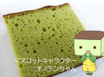
マスコットキャラクター オノデンちゃん